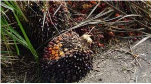
FIGURA 7. Palma.

En España se siembran (aprox. año 2006) 750.000 ha de girasol (alimentación) y 5.000 ha de colza. La soja y la colza y el aceite de palma son de importación (ya sea en grano o en aceite).