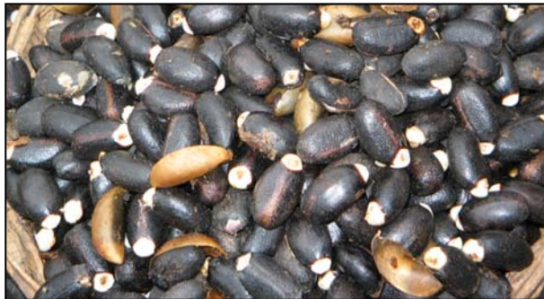
FIGURA 4. Semilla de soja.