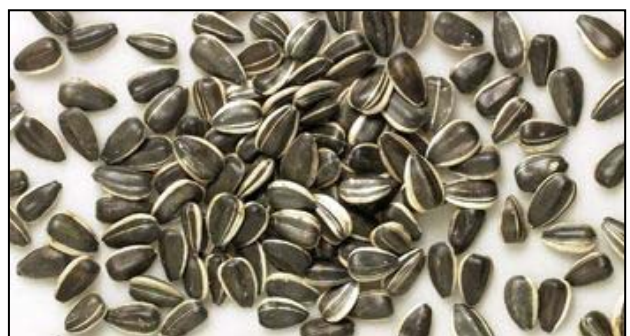
FIGURA 6. Semilla de girasol.