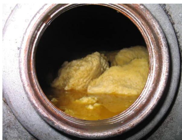
FIGURA 2. Ejemplo de solidificación biodiesel.

El biodiesel solidifica a bajas temperaturas mucho más fácilmente que el diesel normal. El biodiesel es ligeramente más pesado que el petrodiesel (0,88 contra 0,85) siendo el procedimiento para hacer mezclas agregar el biodiesel al petrodiesel (siempre que la mezcla se haga en tanque y no en tubería).