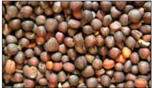
FIGURA 5. Semilla de colza