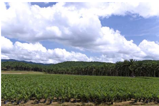
FIGURA 1. Campo de palma en Malasia.

El biodiesel puede ser producido (biodiesel de 1ª generación) partiendo de materias primas agrícolas, aceites vegetales, y/o grasas animales, y/o aceites o grasas de frituras usados. En la actualidad se encuentran en fase de estudio los biodiesel de 2ª generación, partiendo de materias primas residuales (desechos de biomasa) o alternativas (algas).